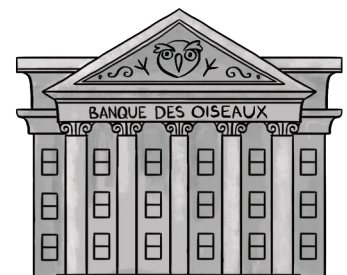
la BANQUE DES OISEAUX